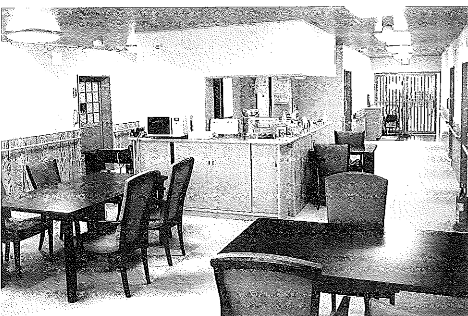
サービス付き高齢者向け住宅のロビー

アを受ける利用者も幸せにはなれない。 「これからは、地域に住むすべての世代の皆さんと、そして医療機関をはじめとするさまざまな社会資源とも連携を図って、地域全体の底上げを図り、高齢者が住み慣れた我が家にと同じように暮らせるための仕組みづくりが必要だ。介護職員も、介護だけでなく、そういう広い視野も持って、高齢者の暮らしを見つめられるようになってほしいですね」 そのための研修会などの充実も図っていく。設備面でも、研修会や講演会などを開くためのスペースを確保している。従来とは全く異なる発想でできた総合ケアセンター内の小さなサービス付き高齢者向け住宅。木のぬくもりがうれしい、心安らぐ住まいになった。