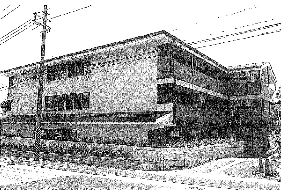
道路側からみた外観